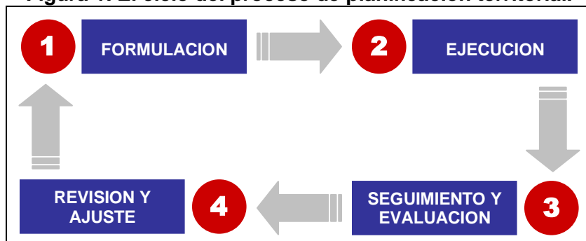
Figura 1. El ciclo del proceso de planificación territorial.